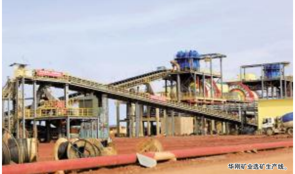
华刚矿业选矿生产线。

华刚矿业股份有限公司是由中国中铁、中国电建组成的中方企业集团,在积极实施国家“走出去”战略,投资开发海外矿业资源背景下,与刚果(金)企业“开发资源、矿业报国”的光荣使命,寄托着刚果政府“发展经济、改善民生”的美好夙愿,凝结着中刚人民“友好合作、平等互利”的共同梦想。